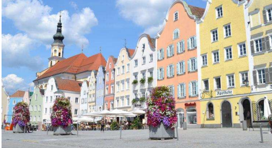
Schärding am Inn

vom 24. – 26. April 2020 in Oberösterreich