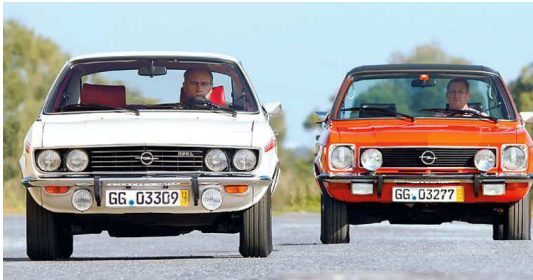
50 Jahre Ascona A – Manta A